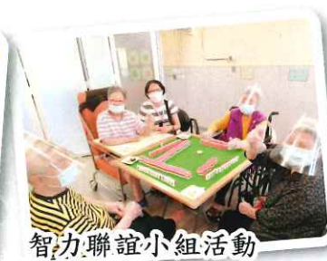
智力聯誼小組活動