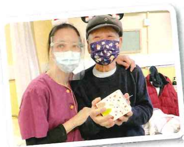
疫情下不一樣的聖誕