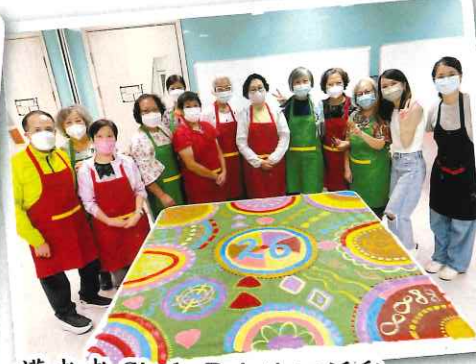
護老者 Circle Painting 活動