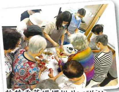
乾花香薰蠟燭掛片工作坊