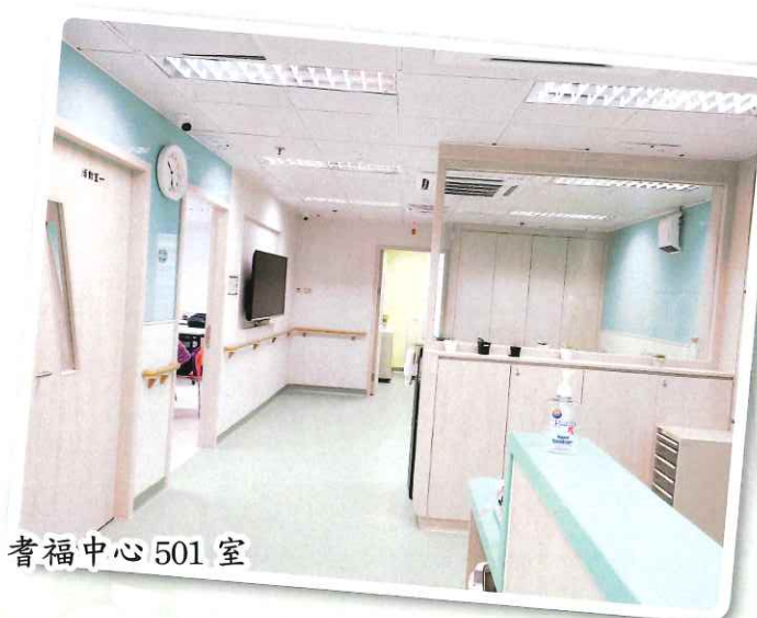
耆福中心 501 室