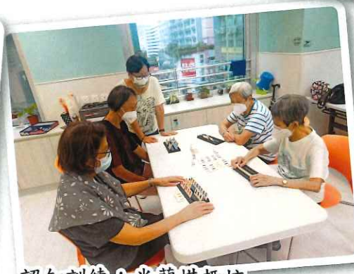
認知訓練：米蘭棋趣坊