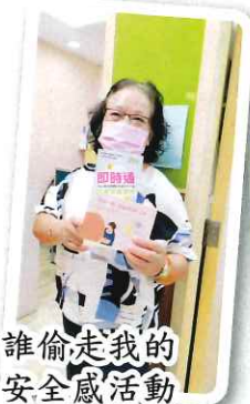
誰偷走我的安全感活動