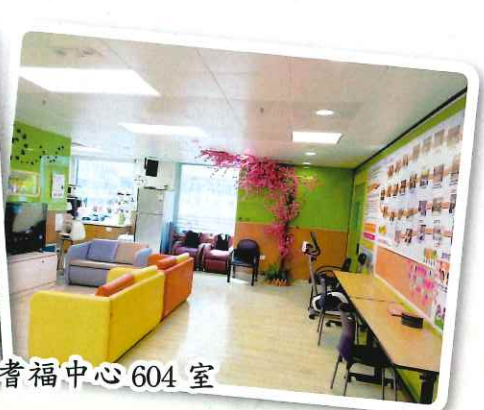
耆福中心 604 室